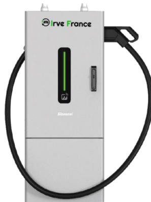
Mini Super chargeur 120 kW